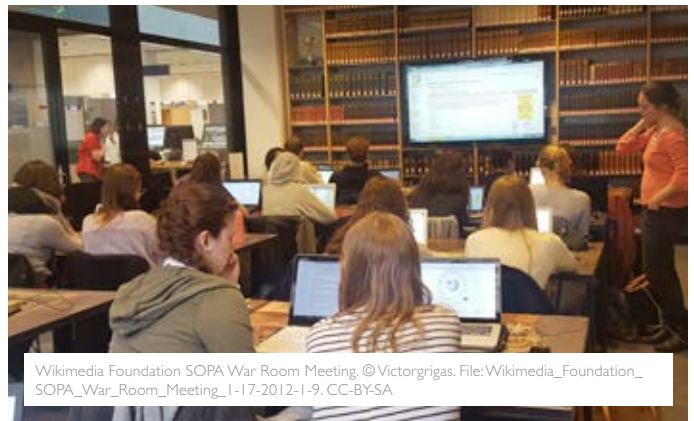
Wikimedia Foundation SOPA War Room Meeting. File:Wikimedia_Foundation_SOPA_War_Room_Meeting_1-17-2012-1-9. CC-BY-SA

Simpel! Ga naar een Wikipedia pagina en klik op bewerken. Voeg informatie toe aan een bestaand artikel, corrigeer een fout, verbeter de taal of – nog beter – schrijf een nieuw artikel over een onderwerp dat nog niet in Wikipedia staat. Wikipedia is zo ontwikkeld dat iedereen een artikel kan bewerken of schrijven. Er is een handleiding en er zijn online cursussen, uitgebreide hulpfuncties en oefenpagina's. Daarnaast zijn er ervaren Wikipediaanen die je graag met raad en daad bijstaan. Om communicatie met andere bewerkers makkelijker te maken kun je een account aanmaken met een zelfgekozen gebruikersnaam. Meer weten? Ga naar Wikimedia Commons en download de meest recente versie van de 'Handleiding Wikipedia'.